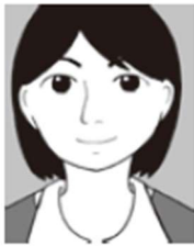
頭頂部がきれ ている