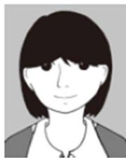
前髪で目が隠 れている