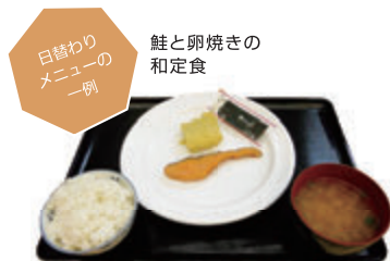
日替わりメニューの一例