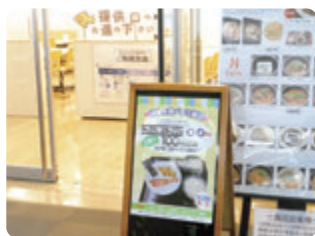
鮭と卵焼きの和定食