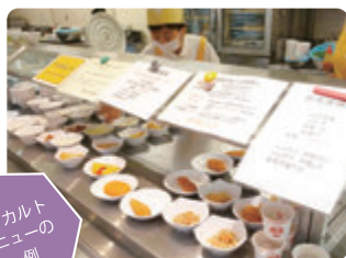
アラカルトメニューの一例