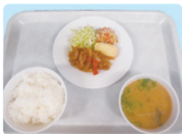
■アジの南蛮漬け、卵焼き、千切大根、ごはん、味噌汁