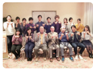
第5回 和歌山県人会 開催日 11月25日(金) ●参加者 20名