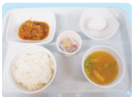
■サワラの揚げ煮、温泉たまご、納豆、ごはん、味噌汁