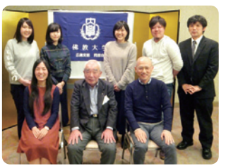
第18回 広島県人会 開催日 11月12日(土) ●参加者 8名