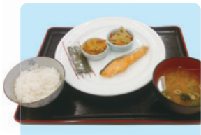
■鮭の塩焼き、小鉢、味付けのり、ごはん、味噌汁