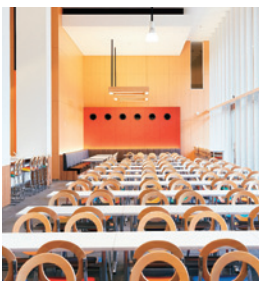
紫野キャンパス1号館地下1階 カフェテリア「笑虹紫」