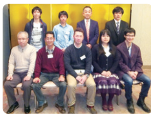
第5回 静岡県人会 開催日 11月19日(土) ●参加者 9名