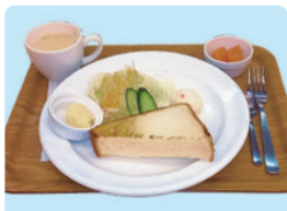
■トースト、ベーコン、スクランブルエッグ、サラダ