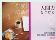
「キャリアガイドブック」(右) 「保護者のための就活作法」(左)

この先の変化する就職環境に対応をするためには、早期から自己理解を進め、就職にむけての準備をすることが大切です。学生が卒業後の進路決定の際には、保護者の存在が「大きな支え」となります。また、保護者の皆さま以上に学生を理解できる「身近な社会人」はいません。親の世代とは変わってきた現在の就職活動の実態を理解すること、学生を信じて見守っていただくこと、そして、適切な声掛けをお願いします。また、就職はゴールではなくスタートです。すべての学生の皆さまの自己実現のため、社会人としてのより良いスタートを切れるように、大学として、更に充実した支援体制の確立に向けた取り組みを進めてまいります。