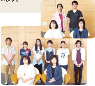
第5回 沖縄県人会 開催日 6月23日(木) ●参加者 10名

出身県(出身地)をキーワードに、学生同士や同窓生の皆さんとの縦横(たてよこ)のつながりを深める会「県人会」を教育後援会や同窓会支部の援助のもとに開催しています。