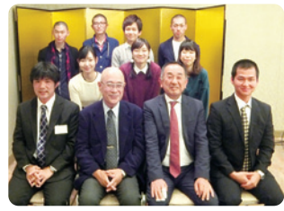
第3回 福岡県人会 開催日 11月11日(金) ●参加者 11名