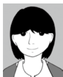
前髪で目が隠 れている