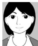
頭頂部がきれ ている