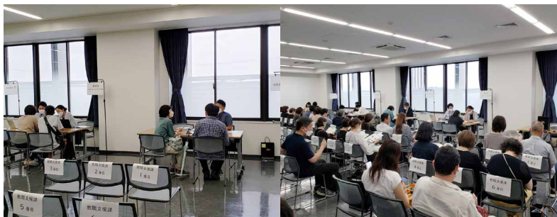
事務局個別相談会