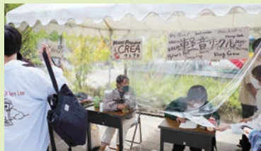
■感染対策をとりながらのクラブ勧誘活動風景