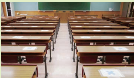
■間隔を空けるために着席場所が指定された教室