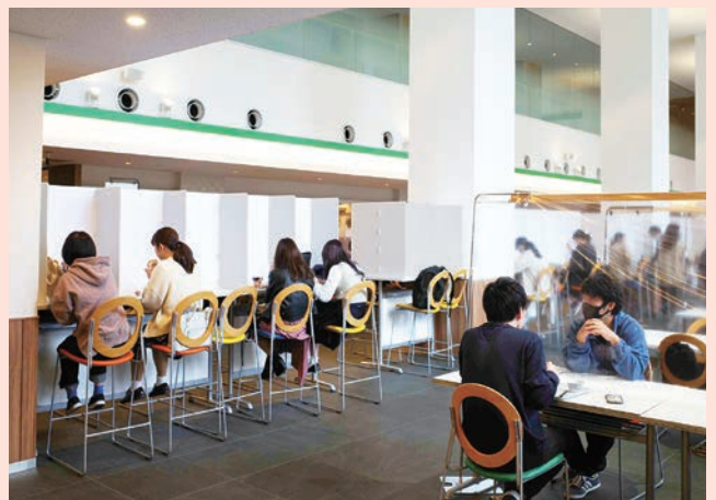
■座席の間に仕切りが設けられた食堂