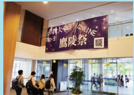
■学生の姿が戻ってきたキャンパス