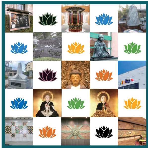
Buddhist Monuments of Bukkyo University